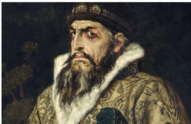
Portrait d'Ivan le Terrible par Viktor Vasnetsov, 1897 (galerie Tretyakov, Moscou)

Pour appuyer sa politique, Vladimir Poutine a dans l'esprit quelques grands leviers historiques. Ils tiennent à son obsession du territoire, à sa foi dans le rôle messianique que la Russie doit jouer dans le monde et à sa certitude que son pays ne peut être gouverné que par la force.