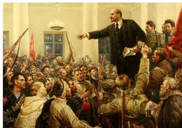
Lénine proclamant le pouvoir des Soviets à la réunion historique du Deuxième Congrès des Soviets de toute la Russie au quartier général des bolcheviques à Saint-Petersbourg - 1917

Cette histoire faite de bruit et de fureur, de conquêtes et de chefs-d'œuvre, de splendeurs et de misères, s'étend bien au-delà des frontières actuelles de la Russie.