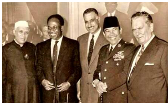
Nehru, Nkrumah, Nasser, Sukarno, Tito

révèlent être des acteurs décisifs de la mondialisation qui leur réussit parfois mieux qu'aux pays du Nord.