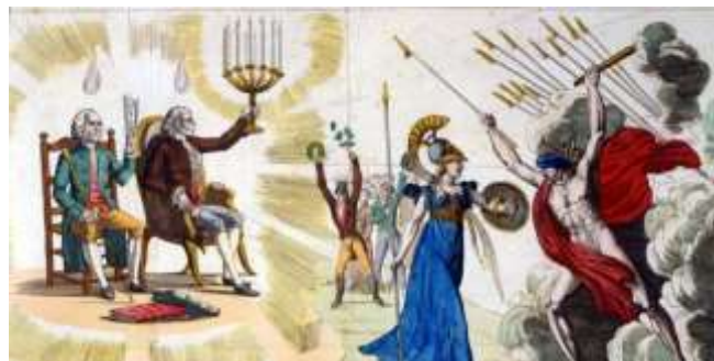
De l'au-delà, les philosophes Rousseau et Voltaire, éclairent le peuple. Allégorie anonyme du XIXe siècle

contradictions : comment organiser le progrès des connaissances sans introduire de nouvelles inégalités ? Comment éviter que la liberté ne favorise les charlatans ? Comment revendiquer l'universalité de la nature humaine sans nier l'égalité des dignités des cultures ?