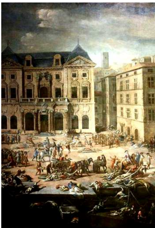
La peste de 1720

Les villes anciennes sont le produit d'une lente stratification de pratiques culturelles et sociales mais aussi de grandes catastrophes comme les tremblements de terre, les incendies, les guerres et les épidémies. Ces événements, intervenus à des moments particuliers de l'Histoire ont entraîné des mutations majeures du tissu urbain et ont fait évoluer les consciences et les modes de représentation de la société.