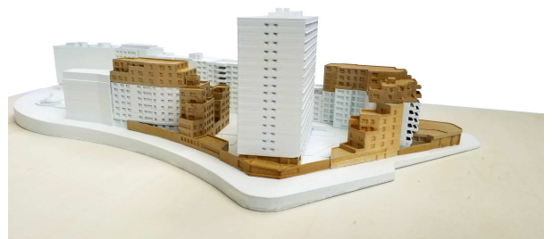
Concours pour la rénovation, extension et surélévation d'un grand ensemble de logements de la seconde moitié du XXème siècle, Place des fêtes, Paris 19ème

L'avènement de ce que Bruno Latour nomme l'Anthropocène nous incite à porter un regard nouveau, une vision plus organique de la ville et de la société : ce qu'on appelle « écologie urbaine ». Cette notion naturaliste émerge au 21ème siècle dans le sillage d'une prise de conscience de nos milieux et de leur aspect fragile et limité. Elle tente d'engendrer des relations nouvelles des sociétés humaines à leur environnement, tout en donnant aux humains la conscience de leur milieu et de son interdépendance avec son environnement.