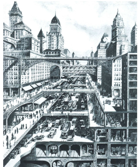
City of the Future by Harvey Wiley Corbett, 1913

économique. La pandémie de covid-19 nous a soudainement ramenés à notre condition naturelle et aux questions primaires de l'existence, telles que l'habitat et le vivre ensemble.